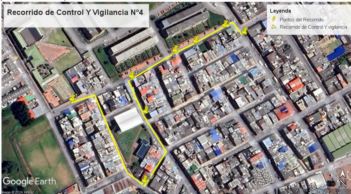
Ilustración 1. Recorrido de Control Y Vigilancia N°4

Se realizó recorrido de control y vigilancia en el cuadrante 3, barrio El Sol el día 19 de abril del 2024, desde las coordenadas 4°43'7.17"N- 74°12'58.855" W hasta las coordenadas 4°43'9,57" N- 74°12'51.438 'W (ver ilustración 1. Ruta amarilla), con el fin de verificar las condiciones ambientales, identificar posibles afectaciones a los recursos naturales y realizar las acciones de prevención correspondientes.